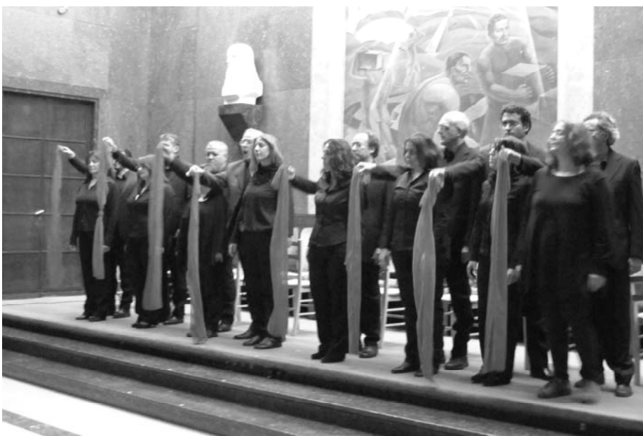
Concerto di Perugia. Un momento del Romancero gitano .