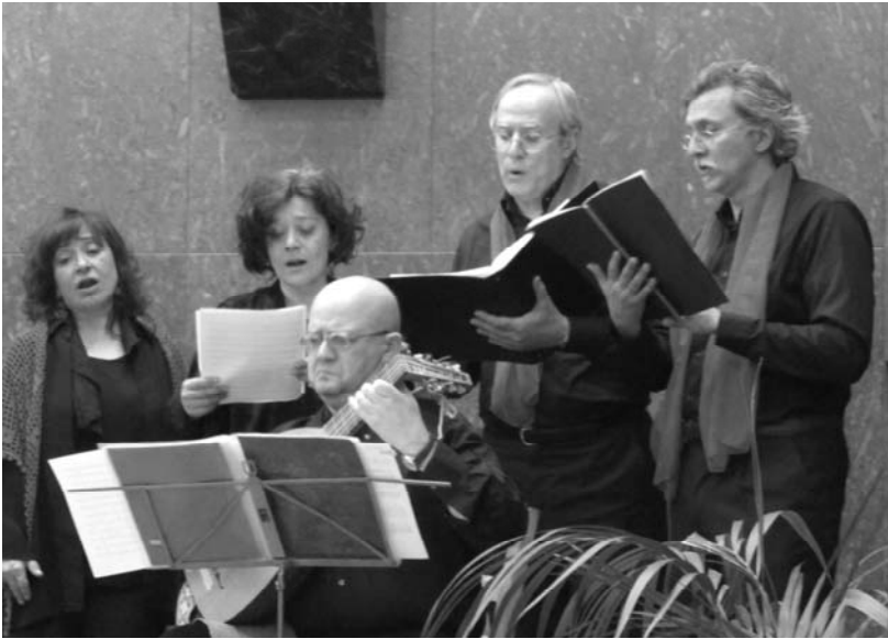
Concerto di Perugia. La Maestra nell'insolita veste di cantante di villancico.

La cena, comunque, si è svolta allegramente tra sorrisi, risate, battute ... e velate minacce di incursione non autorizzata in una delle stanze delle nuove cantanti