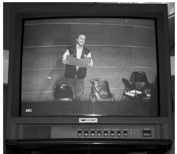
Una foto intensa di un momento intenso dell'intenso concerto tenuto per la BBC dal nostro amico.

Veniamo a sapere solo ora, dal nostro corrispondente da Londra, che un membro di Harmonia ha cantato qualche mese fa per la BBC. Il detto corrispondente si è premurato di inviarcì documentazione fotografica dell'evento, che qui pubblichiamo. È superfluo raccontarvi che, messi a conoscenza del fatto, siamo rimasti un po' male. Ti chiedo, N., perché non ce l'hai detto? Avremmo organizzato un viaggio di gruppo per venirti ad applaudire!